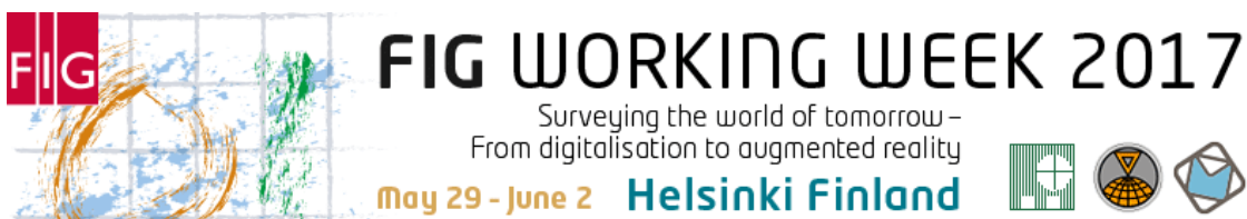
FIG Working Week 2017

La Semana de la FIG, del 29 de mayo al 2 de junio de 2017 en Helsinki, Finlandia, es una conferencia de una semana que reúne a la comunidad internacional de agrimensores, topógrafos y profesionales del ámbito geoespacial en interesantes sesiones plenarias, sesiones técnicas y talleres, como así también una variedad de eventos secundarios y funciones sociales. La semana ofrece una oportunidad única para discutir los desafíos claves de nuestro tiempo dentro de la profesión de agrimensura con otros pares.